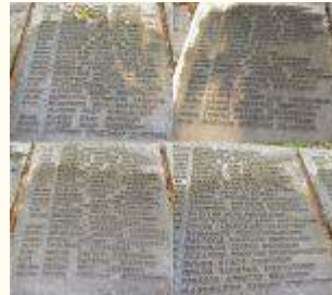
Имена похороненных воинов 207Кб