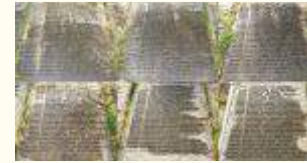
Имена похороненных воинов 213Кб