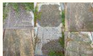
Имена похороненных воинов