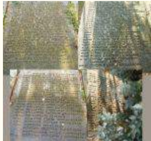
Имена похороненных воинов 377Кб