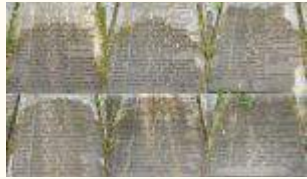
Имена похороненных воинов 219Кб