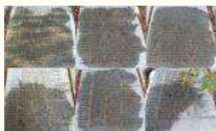
Имена похороненных воинов