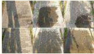
Имена похороненных воинов 201Кб