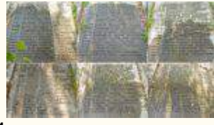
Имена похороненных воинов 200Кб