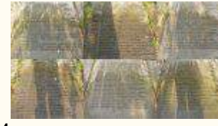
Имена похороненных воинов 199Кб