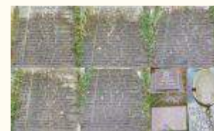
Имена похороненных воинов