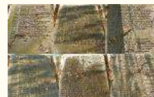
Имена похороненных воинов