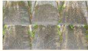
Имена похороненных воинов 212Кб